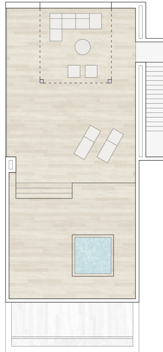
Planta Solarium / Chill Out